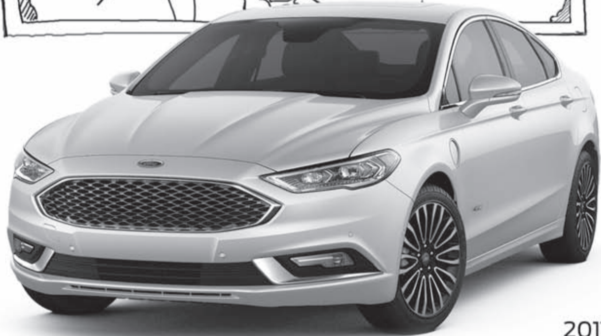
2017 Fusion SE Hybrid

What's the name of that New Sales Tax again? BAV... What!?